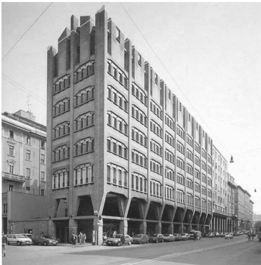
Figura 2. Edifício de escritórios da Ente Nazionale di Previdenza ed Assicurazione Sociale, Bolonha (1952-57), projetado por S. Muratori.

fases de formação urbana, incluindo as influências e as implicações dos novos projetos sobre os edifícios existentes quer no centro histórico das cidades, onde o tecido é compacto, quer nos subúrbios, onde os territórios eram suscetíveis de acomodar um vasto leque de soluções.