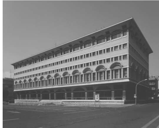
Figura 3. Edifício de escritórios, Roma (1955-58), anterior Sede do Partido Democrata Cristão, projetado por S. Muratori.

Ao considerar os organismos arquitetónicos, Muratori reforça os temas urbanos, como é exemplificado pelo famoso exercício da 'capela em alvenaria'. Aqui, era pedido aos estudantes para planearem um