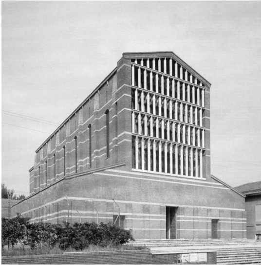
Figura 1. Igreja de S. Giovanni al Gatano, Pisa (1947-70), projetada por S. Muratori.